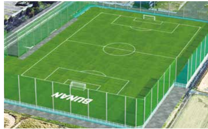
サッカー専用 武南フットボールフィールド

西川口の閑静な住宅街に建つ武南高校。教育施設はもちろん、スポーツ施設、アメニティ施設も充実しています。充実した教育環境で過ごす3年間は、学力やスポーツ能力の向上とともに、豊かな人間性を育みます。