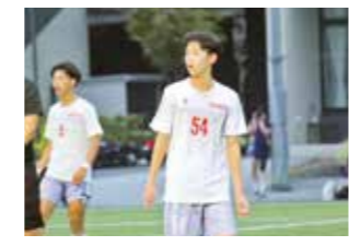
最高の環境でサッカーを追求したくて武南高校を選びました。仲間と共に切磋琢磨した日々は、何物にも代えがたい大切な思い出です。

2年次から選抜コースに進んだことで周囲との差を実感し、勉強時間を少しずつ増やしながら、模試への意識を高め、英語に触れる時間を確保しました。英語は伸びるまでに時間がかかるため、単語・熟語の習得はもちろん、構文を素早く把握する力と英文の論理展開に慣れておくことが、受験勉強を行う上で重要だと思います。ぜひ粘り強く取り組んでください。明治大学は前身が法律学校で、歴史ある法学部があることが魅力的だったので志望しました。将来は法科大学院に進学し、弁護士または検察官になることを目指しています。