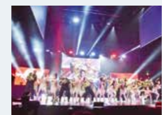
仲間と支え合い、厳しい練習を乗り越えて立った両国国技館の舞台。人生で一番濃い、最高の青春でした。

武南の生徒は、勉強や部活動などに全力で向き合っている人が多く、自分も頑張りたいと思える環境が整っているところが魅力です。受験勉強の際も、クラス全体で良い影響を与え合い、「みんなが頑張っているから自分も頑張ろう」と思える瞬間がたくさんありました。行き詰まりや不安を感じたときには、担任の先生が親身になって話を聞いてくださり、前向きな気持ちに切り替えることができました。将来は先生方が自分にしてくださったように、生徒一人ひとりに寄り添い、その成長を支え、個性を伸ばしていただける教師になれるよう、大学で一生懸命学びたいです。