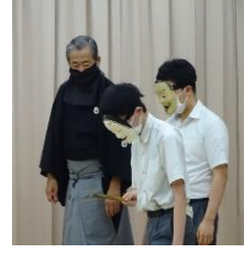
6/21 能楽・3年 (事前学習の様子)