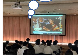
6/14 オペラ・全学年 (事前学習の様子)